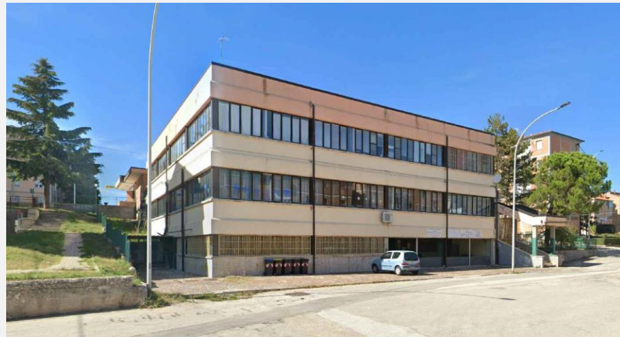
Foto immobile comunale in Via Gramsci allo stato attuale

Modalità di attuazione: co-progettazione con ETS per entrambe le misure FSE+ e FESR