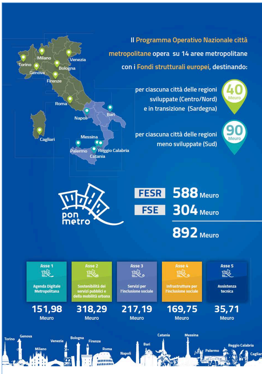
Figura 1 – Il PON Metro in info-grafica